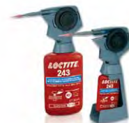
97001 / 98414

Diese Geräte können einfach auf jede 50 ml- oder 250 ml-Flasche aufgeschraubt werden. Sie machen das anaerobe LOCTITE Produktgebilde zu einem tragbaren Handdosiergerät. Sie ermöglichen das Dosieren in jeder Lage, in Tropfengrößen von 0,01 bis 0,04 ml - genau, ohne Tropfen oder Produktvergeudung (für Produkte mit einer Viskosität bis 2.500 mPa·s).