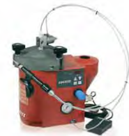
97009 / 97121 / 97201

Das Halbautomatische LOCTITE Dosiersystem ist eine integrierte Konstruktion von Steuergerät und Tank für die Dosierung von vielen LOCTITE Schraubensicherungen mit Hilfe von Ventilen. Mit digitaler Zeitsteuerung, Leermeldung und Fertigmeldung. Quetschdosierventil für die Dosierung im Handbetrieb oder als stationäres System. Die Tanks sind groß genug für die Aufnahme von 1 1/2 kg-Flaschen und sind mit einer Füllstandanzeige für Leermeldung ausgerüstet.